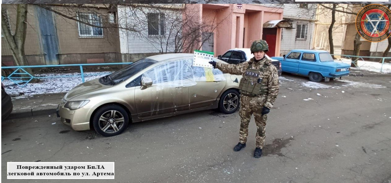
Поврежденный ударом БпЛА легковой автомобиль по ул. Артема