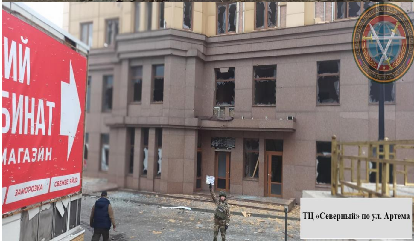
ТЦ «Северный» по ул. Артема

10.01.2025, в 08:45, украинские военные нанесли удар по Киевскому району Донецка с использованием РСЗО М142 HIMARS (М-270). Выпущено несколько осколочных ракет М31. В ходе атаки ранены две женщины, 1963 и 1940 г.р., сотрудник супермаркета «Молоко», 2002 г.р., и работник коммунального предприятия, 1968 г.р. Прямым попаданием разбит супермаркет «Геркулес-Молоко» (ул. Артема). Повреждены остекление и фасады аптеки «Сарепта» (ул. Артема) и торгового центра «Северный» (пр. Киевский)