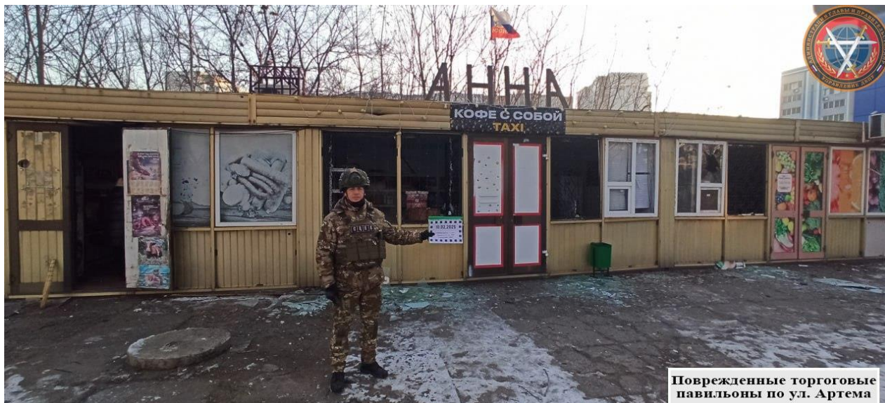
Поврежденные торговые павильоны по ул. Артема