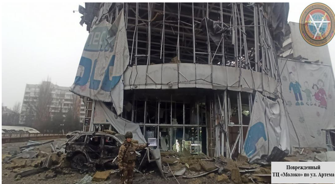
Поврежденный ТЦ «Молоко» по ул. Артема