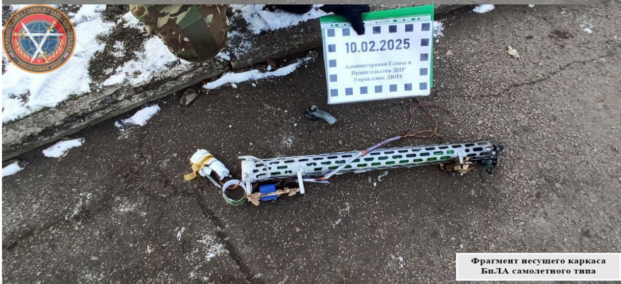
Фрагмент несущего каркаса БпЛА самолетного типа

09.02.2025, в 23:30, ударные БПЛА украинских вооруженных сил атаковали Киевский район Донецка. Разбиты остекление и фасады многоквартирного жилого дома, торговых павильонов и остановки общественного транспорта «Площадь Шахтерская» (ул. Артема). Кроме того, повреждены четыре легковых автомобиля и дорожное покрытие